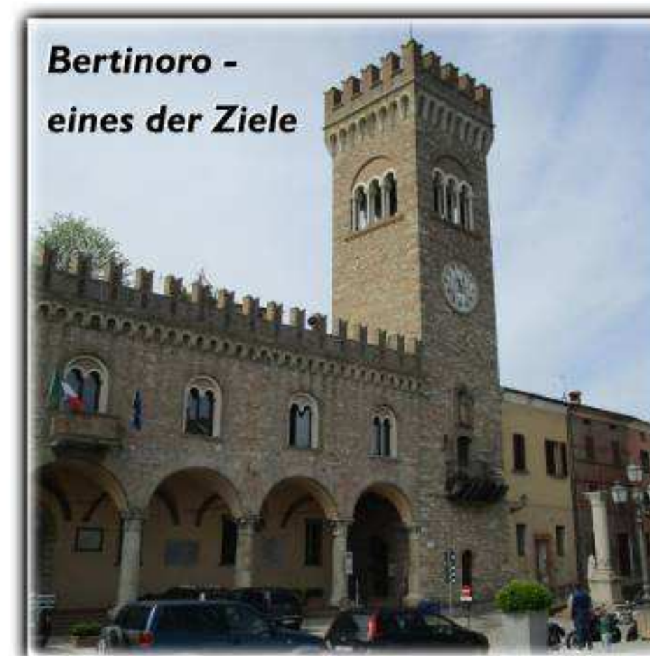
Bertinoro - eines der Ziele

werner.koglin@googlemail.com www.radsportferien-italien.de